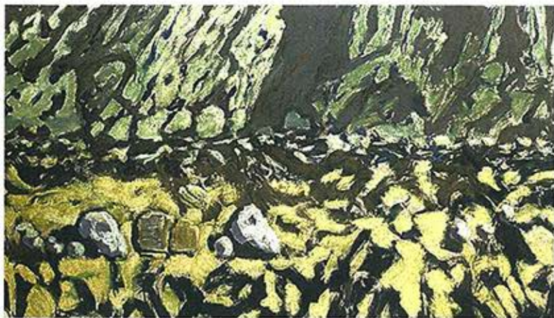
Œuvre de Guy de Malherbe.